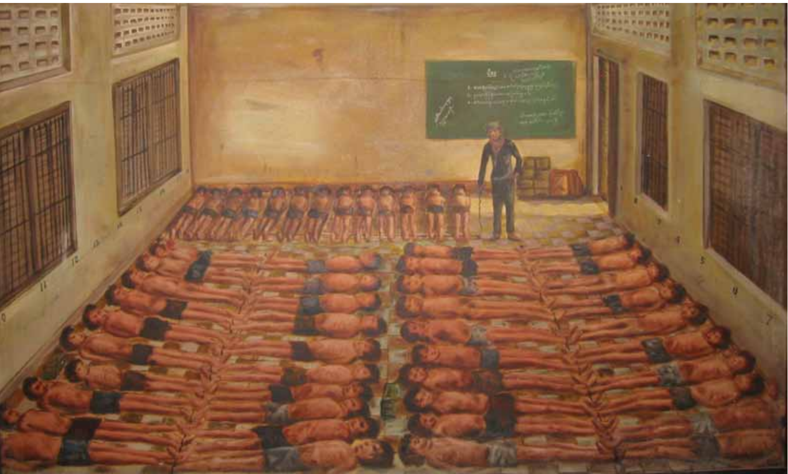
រូបគំនូរគូរដោយលោក វ៉ាន់ ណាត អ្នករស់រានមានជីវិតពីមន្ទីរ ស-២១ ដែលដាក់តាំងនៅជញ្ជាំងនៃសារមន្ទីរ ទួលស្លែង ។ រូបថតនេះដកស្រង់ចេញពីសំណុំឯកសារនៃសំណុំរឿង ០០១ និងត្រូវបានដាក់ជាកម្មតាងជូនអង្គជំនុំជម្រះក្នុងអំឡុងពេលសវនាការ ។