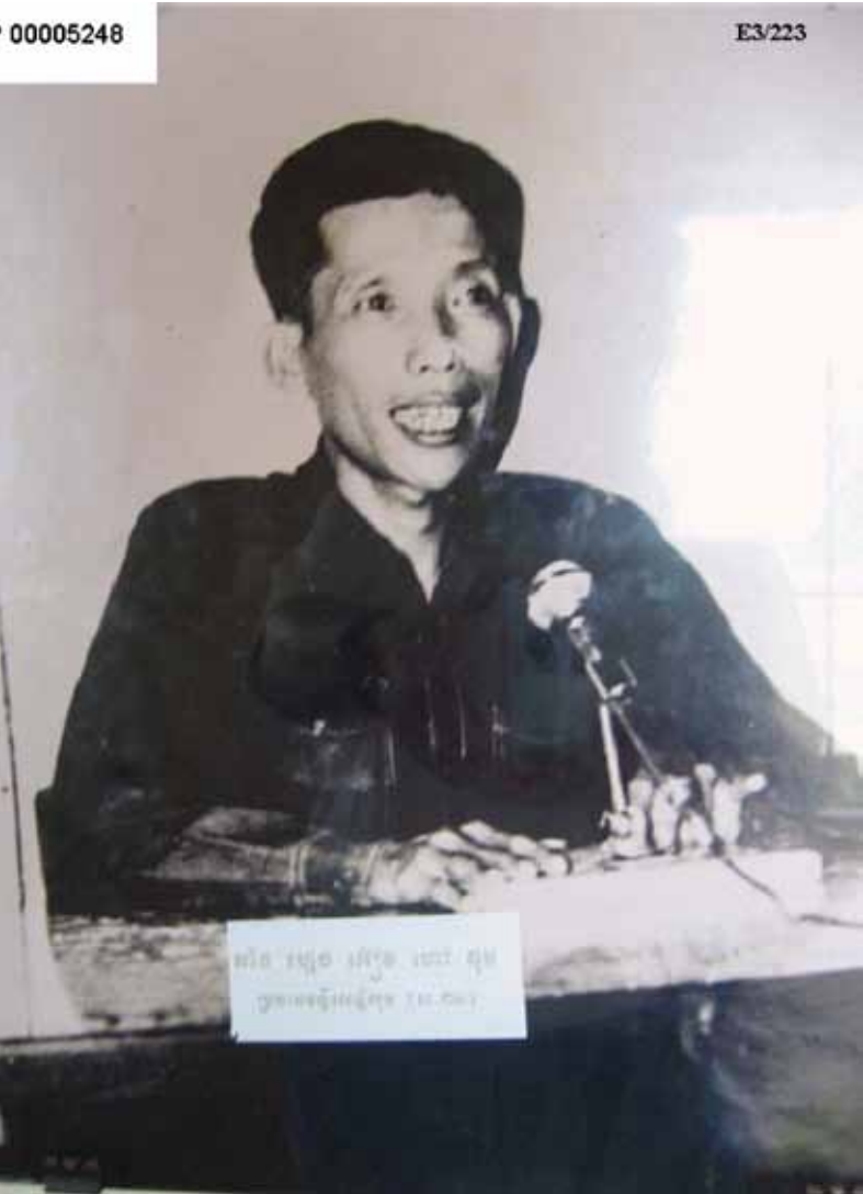
កាំង ហ្គេកអិវ ហៅ ឌុច ផ្តល់បទឧទ្ទេសនាមក្នុងអំឡុងរបបកម្ពុជាប្រជាធិបតេយ្យ។ រូបថតនេះដកស្រង់ចេញពីសំណុំឯកសារនៃសំណុំរឿង ០០១ និងត្រូវបានដាក់ជាកំស្ពតាងជូនអង្គជំនុំជម្រះក្នុងអំឡុងពេលសវនាការ។