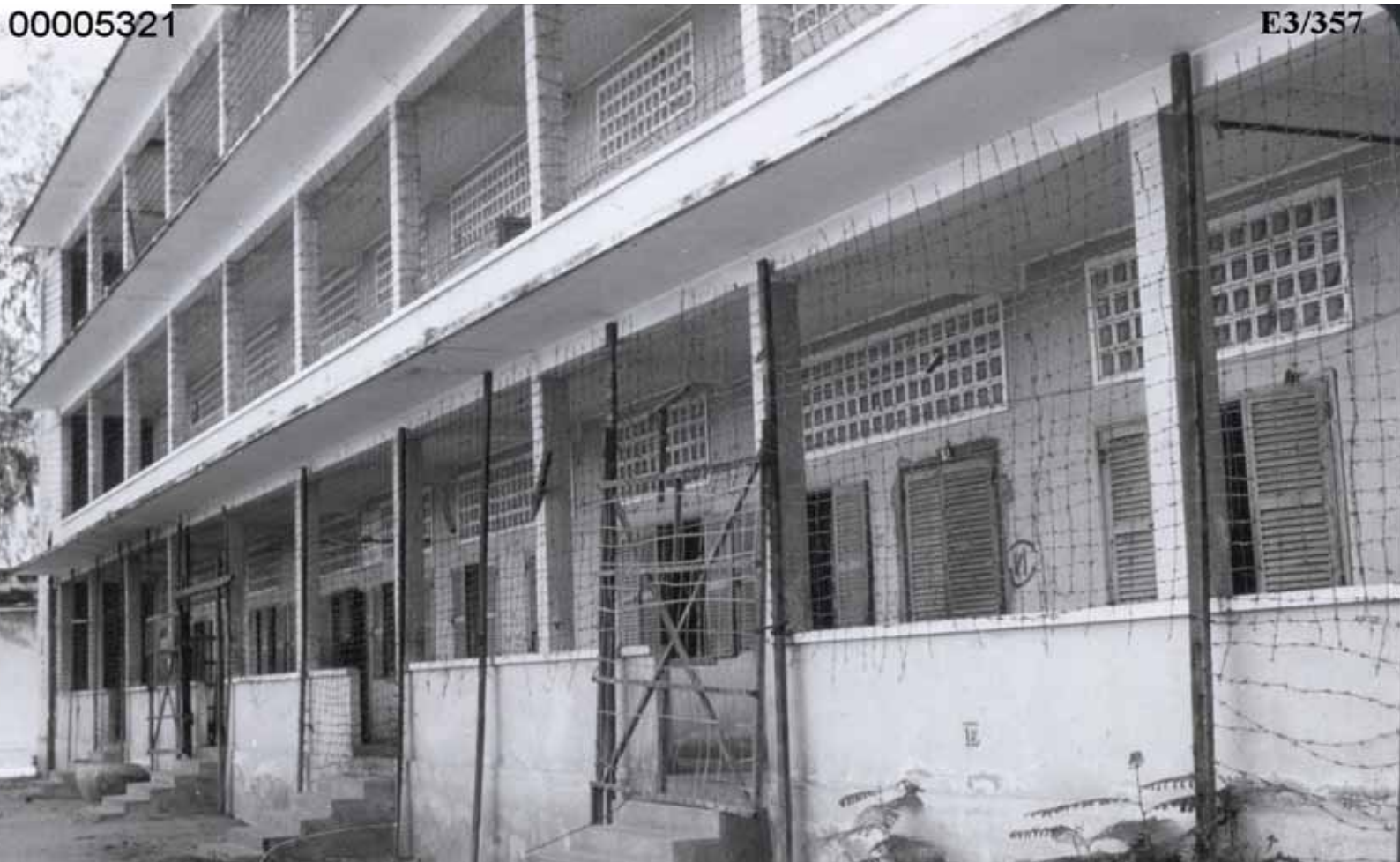
អគារ "គ" នៃមន្ទីរ ស-២១ នៅឆ្នាំ១៩៧៩ ។ រូបថតនេះដកស្រង់ចេញពីសំណុំឯកសារនៃសំណុំរឿង ០០១ និងត្រូវបានដាក់ជាកំណត់សម្គាល់ក្នុងអង្គជំនុំជម្រះក្នុងអំឡុងពេលសវនាការ ។