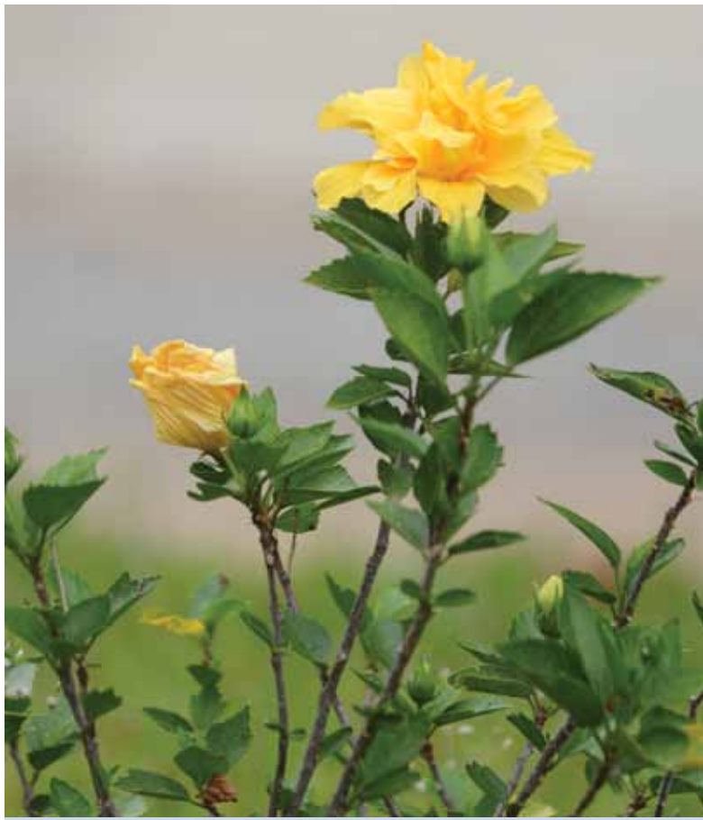
ដើមផ្កានៅវាលពិឃាតជើងឯក

នឹកទៅដល់ជនរងគ្រោះដ៏អក្ខន្តនិងក្រុមគ្រួសាររបស់គេ។ គេទាំងឡាយ បានរងទុក្ខវេទនា រងទារុណកម្ម រងការប្រមាថមើលងាយដ៏សែនមហា អមនុស្សធម៌រាប់មិនអស់មុននឹងបាត់បង់ជីវិតរលត់សង្ហារទៅ។ ខ្ញុំមាន វិប្បដិសារីជ្រាលជ្រៅដែលមិនអាចថ្លាថ្លែងបាន គឺវិប្បដិសារីដែលសុខ ចិត្តឱនក្បាលទទួលការជំនុំជម្រះតែម្នាក់ឯងក្នុងក្របខ័ណ្ឌ ស-២១ ហើយប្តេជ្ញាចិត្តយ៉ាងមុតមាំថានឹងធ្វើអ្វីៗទាំងអស់ដើម្បីឲ្យជាតិ