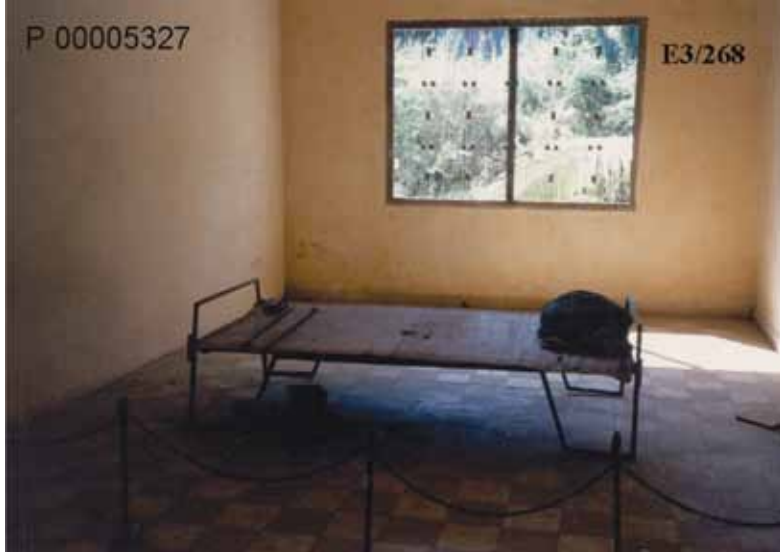
គ្រួសារម្នាក់ដាក់អ្នកទោស ដោយមានប្រាក់និងខ្លោះជើង។ រូបថតនេះដកស្រង់ចេញពីសំណុំរឿងសំណុំរឿង ០០១ និងត្រូវបានដាក់ជាកម្លាំងជូនអង្គជំនុំជម្រះក្នុងអំឡុងពេលសវនាការ។

អស់។ ខ្ញុំនៅតែសុំឧទាហរណ៍ចំពោះវិញ្ញាណក្ខន្ធនៃអ្នកដែលស្លាប់បាត់បង់ទៅដោយសេចក្តីគោរពលំអុតលំឱនបំផុត។ ខ្ញុំបានអធិដ្ឋានចំពោះព្រះជាម្ចាស់ សូមព្រះអង្គប្រទានពរដល់វិញ្ញាណក្ខន្ធទាំងអស់នោះ ដោយព្រះទ័យអនុគ្រោះ។ ចំពោះអ្នកដែលរួចជីវិតផុតពីសេចក្តីស្លាប់ ខ្ញុំនៅតែទទួលស្គាល់ថា ឧក្រិដ្ឋកម្មទាំងអស់របស់ ស-២១ ទៅលើអស់លោក ទទួលស្គាល់ទាំងខាងផ្លូវច្បាប់ ទាំងខាងផ្លូវចិត្ត ចំពោះក្រុមគ្រួសារជនរងគ្រោះ ខ្ញុំនៅតែប្រកាន់អាកប្បកិរិយាឱនលំទោសសូមអនុញ្ញាតទុកទ្វារសូមទោសឱ្យនៅចំហ ហើយនិងសូមរំលែកទុកសោកដីសែនខ្លោចផ្សាររ៉ាំរ៉ៃរបស់អស់លោកគ្រប់ពេលវេលា។