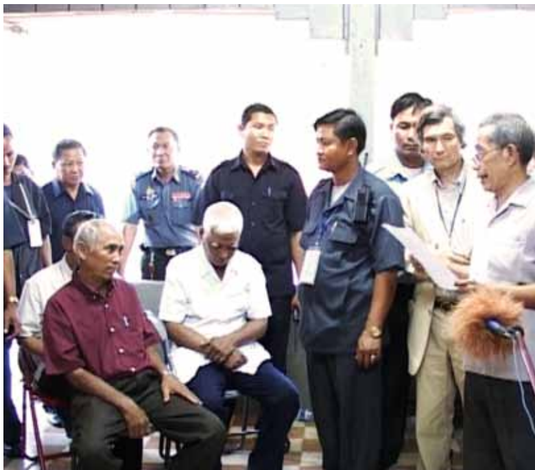
កាំង ហ្គេកអារ ហៅ ឌុច អានសេចក្តីសុំអភ័យទោសចំពោះជនរងគ្រោះនៃ មន្ទីរ ស-២១ នៅក្នុងការធ្វើគ្រាប់ឡើងវិញនៅទួលស្លែង នៅថ្ងៃទី២៧ ខែកុម្ភៈ ឆ្នាំ២០០៨ ។