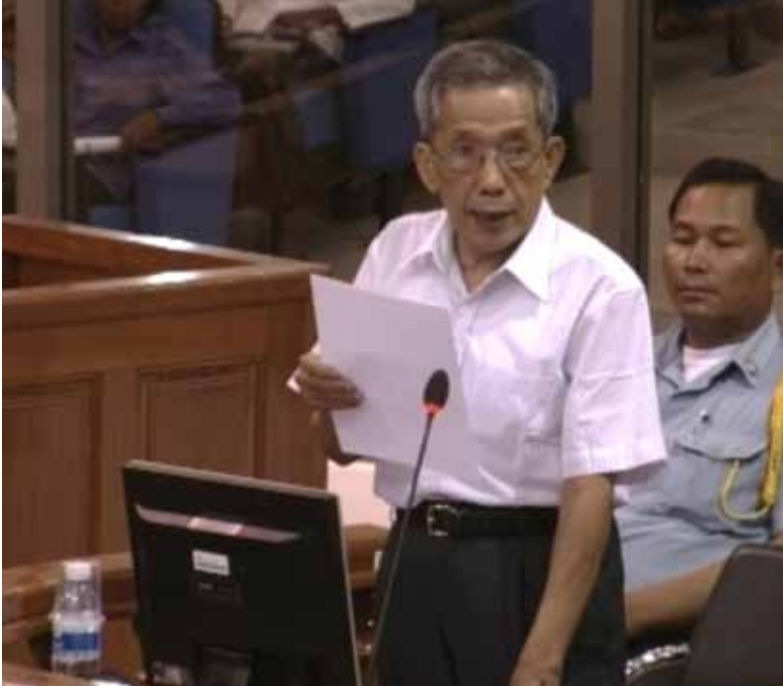
កាំង ហ្គេកអ៊ាវ ហៅ ឌុច កំពុងអានសេចក្តីសុំអភ័យទោសចំពោះអ្នករស់រានមានជីវិតពីមន្ទីរ ស-២១ និងចំពោះក្រុមគ្រួសាររបស់ជនរងគ្រោះដែលបានបាត់បង់ជីវិតនៅមន្ទីរ ស-២១ នៅក្នុងសវនាការថ្ងៃទី៣១ ខែមីនា ឆ្នាំ២០០៩ ។

ខ្ញុំសូមសម្តែងនូវវិប្បដិសារី សោកស្តាយយ៉ាងឈឺចាប់បំផុត