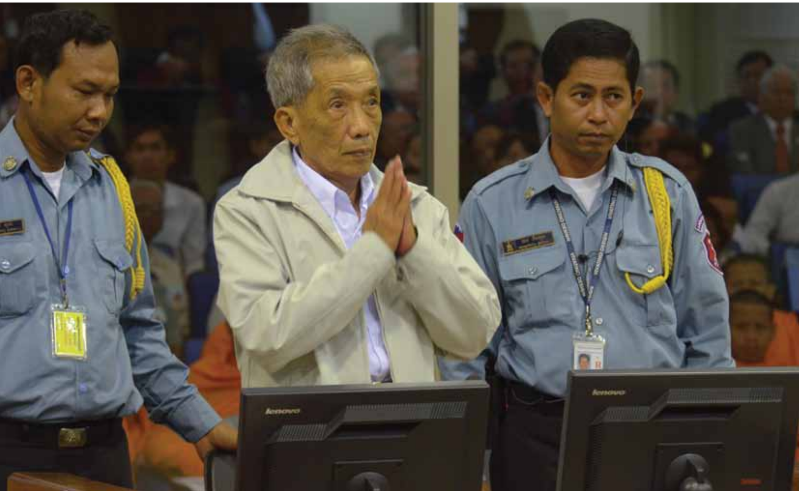
កាំង ហ្គេកអាវ ហៅ ឌុច នៅក្នុងបន្ទប់សវនាការថ្ងៃទី៣ ខែកុម្ភៈ ឆ្នាំ២០១២ ។ នៅក្នុងសាលដីកាសាលា អង្គជំនុំជម្រះតុលាការកំពូលបានសម្រេចផ្ដន្ទាទោសដាក់ពន្ធនាគារ ឌុច អស់មួយជីវិត ។